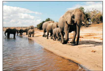
高比野生動物保護區