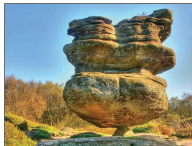
「地質奇觀」 平衡石公園