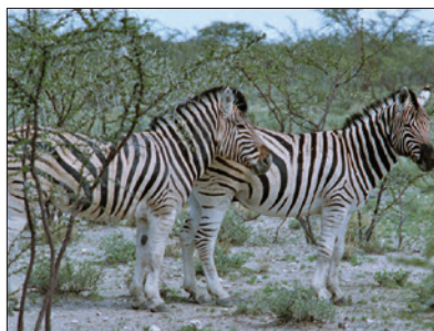
「蠻荒樂園」 高比野生動物保護區