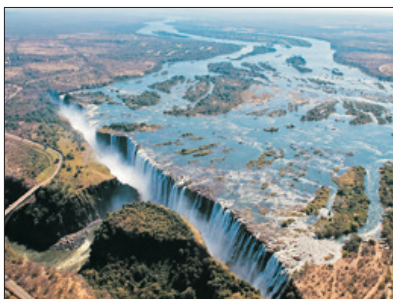
「世界三大瀑布之一」 維多利亞大瀑布