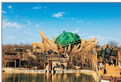
「盤古開天」體驗設施