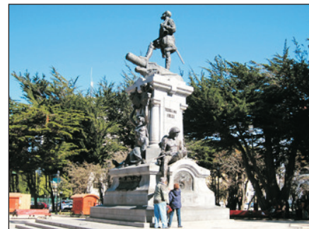
穆尼奧斯·加斯羅廣場