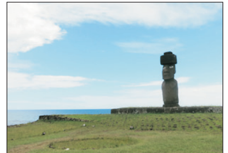
摩艾石巡禮之旅(阿胡高特威庫)