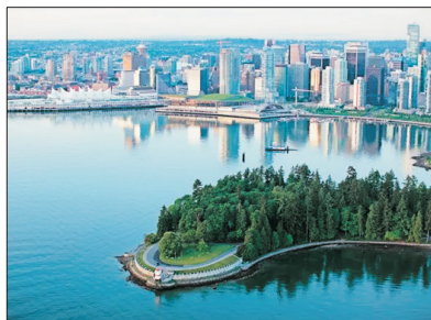
「世界最適宜居住城市之一」 溫哥華

是溫哥華最早開發的社區，鎮內既保留了復古及正宗維多利亞式風格的建築，又充滿富有現代感的商店，煤氣鎮已列入歷史城區及加拿大國家史蹟。而蒸氣鐘是鎮內最著名的景點，當年是為了蓋住蒸汽出口而興建，最有趣的是每過1小時，蒸氣鐘便會發出悅耳的音樂聲響。