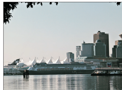
「溫哥華地標」 加拿大廣場

位於加拿大西部沿岸地區，是加拿大第三大城市。溫哥華氣候溫和，擁有多個得天獨厚、壯麗的自然美景，使它能成為享樂主義者的樂園，曾多次被聯合國及其他組織評為「世界最適宜居住城市」之一，亦是著名的旅遊度假勝地。