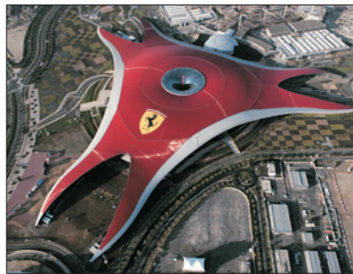
法拉利主題樂園 (包門票及暢玩指定遊戲)

遊覽2010年開幕之超級摩天大樓～哈利法塔，樓高828米，更安排乘搭電梯直達124/F全球最高的觀光層飽覽杜拜景色。樓層逾160層，95公里外仍可見。杜拜塔創下了多個世界紀錄，包括世界第一高樓、最高獨立建築、樓層層最多、最高戶外觀景台等等。