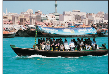
杜拜傳統水上的士ABRAS