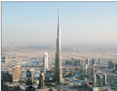
哈利法塔Burj Khalifa 124/F全球最高觀光層(包門票)

遊覽2010年開幕之超級摩天大樓～哈利法塔，樓高828米，更安排乘搭電梯直達124/F全球最高的觀光層飽覽杜拜景色。樓層逾160層，95公里外仍可見。杜拜塔創下了多個世界紀錄，包括世界第一高樓、最高獨立建築、樓層層最多、最高戶外觀景台等等。