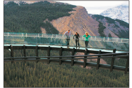
冰川空中觀景走廊