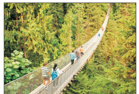
卡佩蘭奴吊橋公園