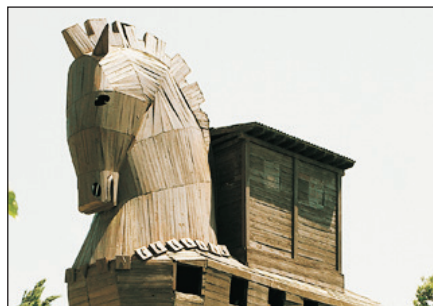
世界文化遺產～特洛伊古城