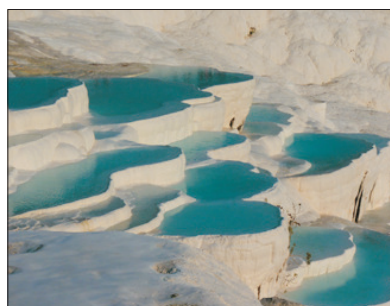
「世界自然及文化雙遺產」 棉花堡

特別安排於「世界自然及文化雙遺產」～奇石區(加柏都斯亞)遊覽，此處地形奇特，有許多由火山熔岩形成尖岩、懸崖、深谷等。