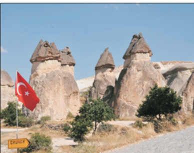
「世界自然及文化雙遺產」 奇石區

特別安排於「世界自然及文化雙遺產」～奇石區(加柏都斯亞)遊覽，此處地形奇特，有許多由火山熔岩形成尖岩、懸崖、深谷等。