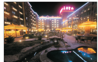
王朝聖地溫泉度假酒店