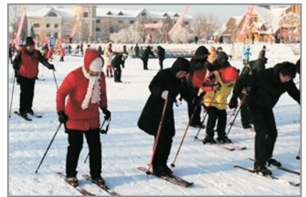
伏爾加莊園滑雪場