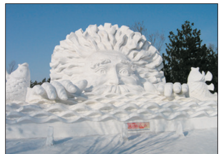
太陽島公園~國際雪雕藝術博覽會

Day 6 哈爾濱—太陽島公園~國際雪雕藝術博覽會(包入場)(如因天氣原因而未能開放, 則改為參觀東北虎林園)—伏爾加莊園(三隻熊樂園、俄羅斯套娃手工坊、俄式麵包坊、【重本安排: 越野滑雪(連雪具)及暢玩高山雪圈(1次)或城堡滑雪(1小時)(註10)】、伏特加酒堡、普希金沙龍)—【超重本·探訪來自芬蘭聖誕老人村的聖誕老人(在小木屋與聖誕老人互動、合照)、更細意安排聖誕老人為每位永安貴賓親手送上聖誕禮物及祝福】