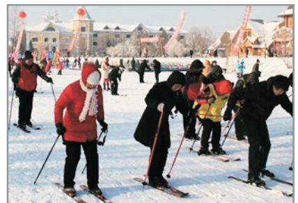
伏爾加莊園滑雪場