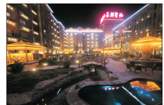
王朝聖地溫泉度假酒店