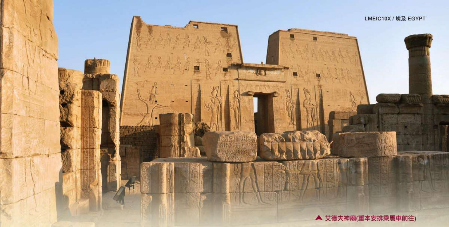
▲ 艾德夫神廟(重本安排乘馬車前往)