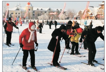
伏爾加莊園滑雪場