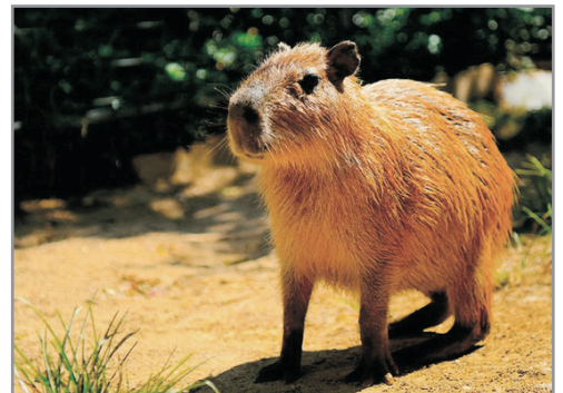
名護NEO自然動植物公園