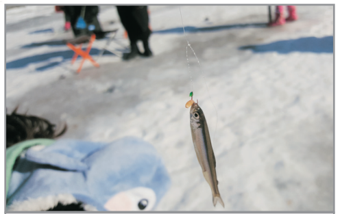
《增遊》楊平冰魚節 (1月8日至2月8日出發團隊適用)