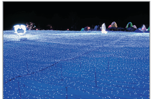
晨靜樹木園~五色彩光庭園展