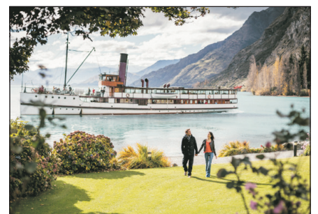
厄恩斯勞號百年蒸汽船