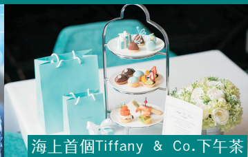
海上首個Tiffany & Co.下午茶