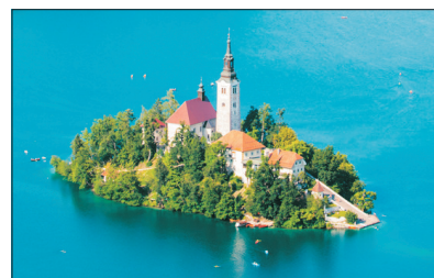
「東歐世外桃源」 碧湖

探訪「世界文化遺產」古姆洛夫城，於十六世紀由意大利建築師重修，充滿文藝復興建築色彩。