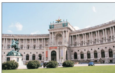
「維也納兒童合唱團表演場地」 荷夫堡

位於維也納市中心環城大道內的王宮建築群，既是歷代奧地利皇帝的冬宮，亦是世界聞名之維也納兒童合唱團的表演場地。荷夫堡建築風格獨特，有哥德式、文藝復興式，以及巴洛克式等，美麗而輝煌。