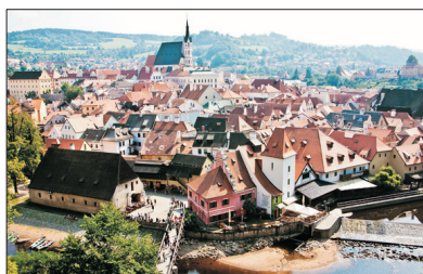
「世界文化遺產」 古姆洛夫城

位於維也納市中心環城大道內的王宮建築群，既是歷代奧地利皇帝的冬宮，亦是世界聞名之維也納兒童合唱團的表演場地。荷夫堡建築風格獨特，有哥德式、文藝復興式，以及巴洛克式等，美麗而輝煌。