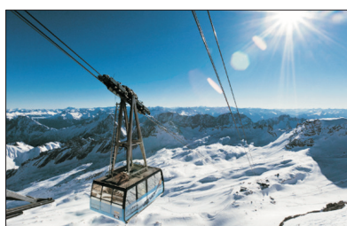
「高峰美景」 楚格峰大雪山

特別遊覽風景怡人的無煙環保城～采爾瑪特，瑞士有九個環保鎮，全城沒有汽車，只有小量以電池推動的小車作運輸之用，居民都喜愛徒步於大街小巷，間中更可見以馬車代步的居民，煞是有趣！