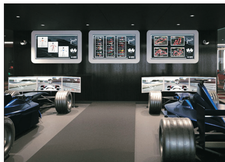
一級方程式模擬賽車