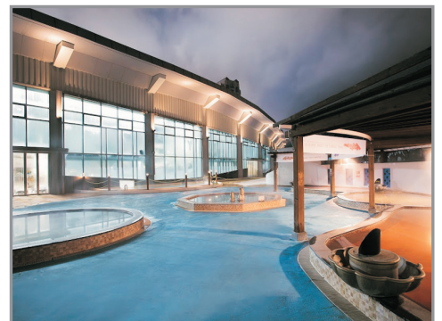
Blue Canyon 溫泉水上樂園