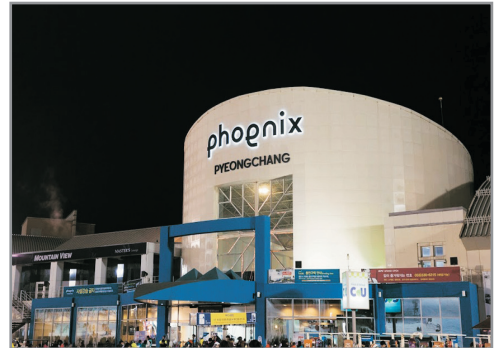
Phoenix PyeongChang 滑雪場