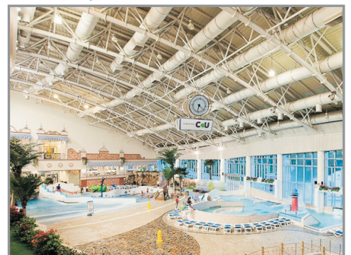
Blue Canyon 溫泉水上樂園