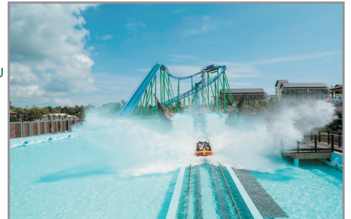
Desaru Coast Adventure 水上樂園

迪沙魯水上探險樂園 Desaru Coast Adventure Water Park、 居鑾 Aw Pottery 陶瓷中心、Zenxin Organic Park 有機農場、 Pavilion 購物廣場、三井 Outlet Park、“七彩階梯”黑風洞