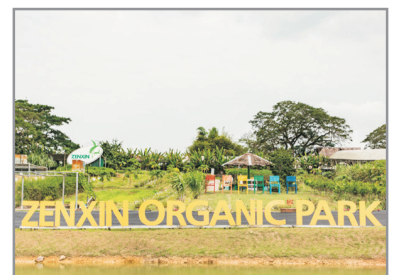
有機農場Zenxin Organic Park