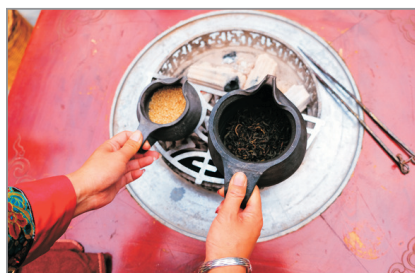
白族民間飛鹽茶會