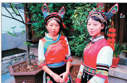
白族傳統民族服飾