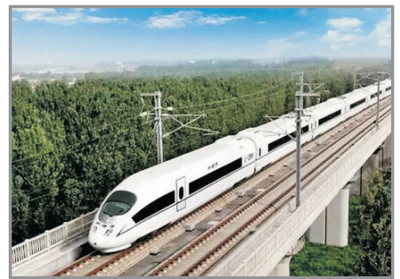
雲南滇西高速動車