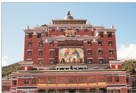
香巴拉藏文化博物館