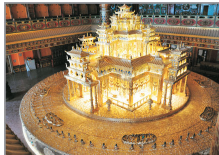
香巴拉藏文化博物館

#因應內陸航班之機位分配，或有可能改為第5天早上從中甸飛往昆明，行程住宿則改為連續2晚入住香格里拉酒店，並減少一晚昆明住宿，有關之安排將於出發前由領隊通知作實。