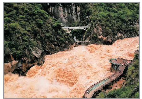
虎跳峽大峽谷景區