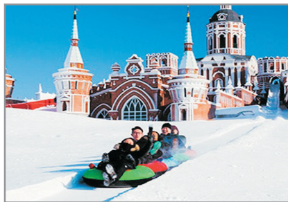
伏爾加莊園滑雪場