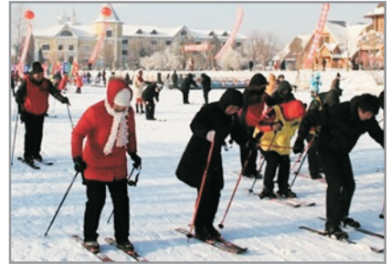
伏爾加莊園滑雪場