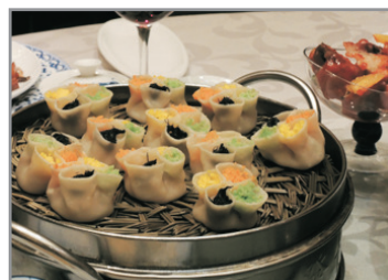
百年老店～德發長餃子宴

華山(包景區環保車)(遊覽時間約3.5小時)【乘索道往返北峰*(遊覽諸峰名勝)】—【華山論劍宴】—秦始皇兵馬俑博物館(包電瓶車入場)(遊覽時間約2.5小時)【一、二、三號坑+銅車馬展廳】 *如遇華山北峰索道封閉或維修，將改為西峰索道往返