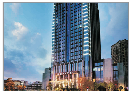
昆明國際品牌Sofitel酒店