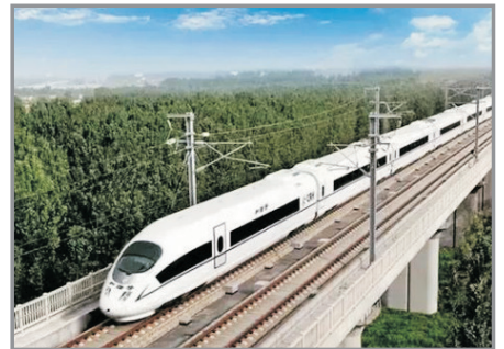
雲南滇西高速動車

▲因應內陸航班的機位分配，或有可能改為先由昆明乘動車往大理，第7天由芒市飛往昆明，行程次序亦會作出相應調動，有關安排將於出發前由領隊通知作實。