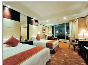
武漢江城明珠豪生酒店客房

坐落於鄰近觀光景點及商場的市中心，位置優越便利、設施完善舒適。酒店同時坐擁氣勢磅礴的長江美景，所有房間均享有武漢市區或長江的景觀。