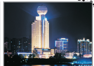
武漢江城明珠豪生酒店