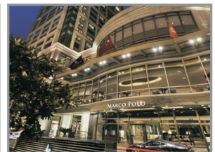
武漢馬哥孛羅酒店