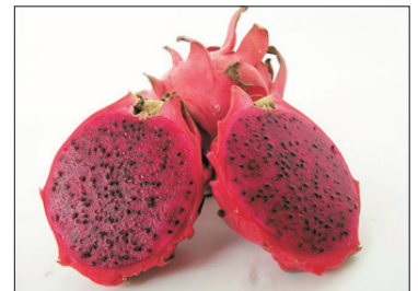
馬來西亞各式水果