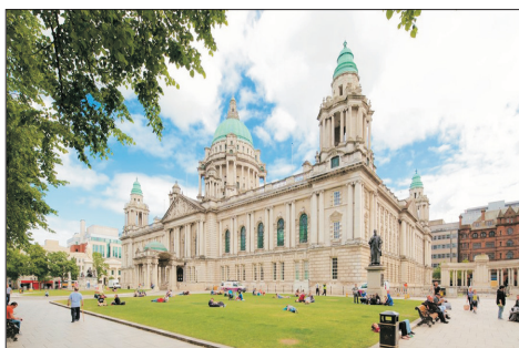
貝爾法斯特(北愛爾蘭)