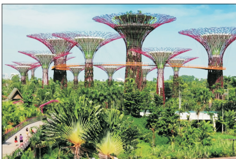
濱海灣花園(新加坡)