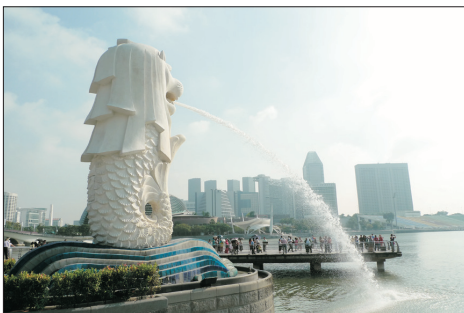
魚尾獅頭像(新加坡)