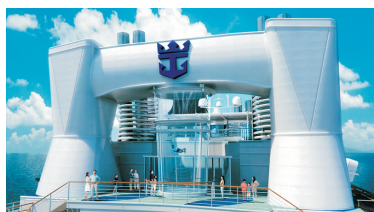
Ripcord by iFly海上跳傘體驗®*