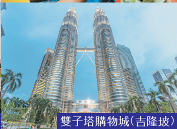
雙子塔購物城(吉隆坡)