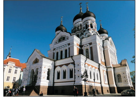
東正教亞歷山大教堂

Day 6 塔林—東正教亞歷山大教堂—「世界文化遺產」古城區—卡狄奧皇宮—(乘渡輪)—赫爾辛基(芬蘭) Tallinn-Alexander Nevsky Cathedral-Old Town-(By Cruise)-Helsinki (Finland) ~「東正教亞歷山大教堂」：教堂建於十九世紀，是城內唯一的富有俄國色彩的東正教堂，教堂對面是國會大廈。