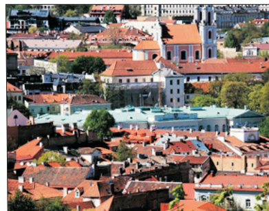
「拉脫維亞首都」 里加

暢遊愛沙尼亞首都塔林、由皇宮改建成的藝術博物館、閒逛於古城區選購精緻陶器及手製布公仔。