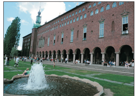
斯德哥爾摩市政廳

Day 8 斯德哥爾摩—市政廳(黃金大廳、藍色大廳)(包入場)—古城區—(途經：皇宮)—華莎戰船博物館(包入場)—(自由活動)→香港(經赫爾辛基轉機) Stockholm-City Hall-Golden Hall-Blue Hall-Old Town-(Pass by : Royal Palace)-Vasa Museum-(Free for Leisure)→Hong Kong(Transit at Helsinki) ~「斯德哥爾摩」：遊覽遺跡舉目皆是之斯德哥爾摩舊城區，優美壯麗的市會堂，雕欄玉砌之黃金大廳更是諾貝爾獎頒獎盛事會場(包入場)。 ~「華莎戰船博物館」：於1628年處女航時沉沒之戰船——華莎號，於1961年方能成功打撈，並建成博物館供人參觀。