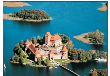
特拉凱城堡歷史博物館

~「 十字架山 」：此山滿佈各類形大小小種類不同之十字架。蘇聯統治期間，當地人為被流放到西伯利亞之親人祈禱祝福，更是當地信徒許願必到之地，相傳曾於此山發現神跡。教宗也曾到此祈禱。各團友可自備一個十字架許下自己之心願，或替至親朋友祝福祈禱，以期願望成真。