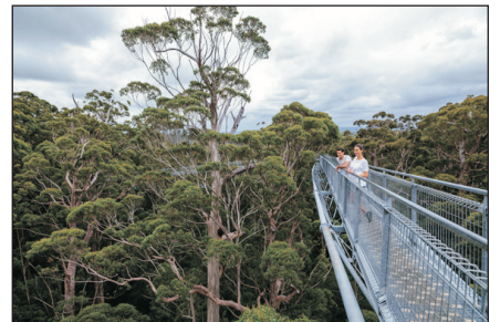
巨人谷樹頂步行道