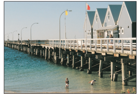
巴修爾頓木棧道碼頭