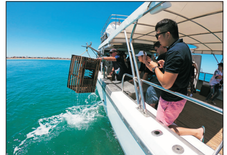
尋捕龍蝦遊船之旅