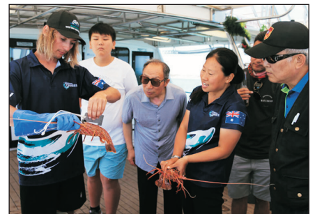
尋捕龍蝦遊船之旅