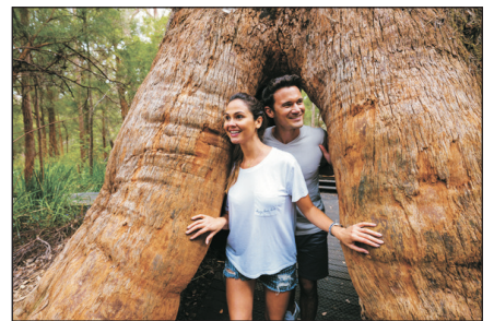
巨人谷樹頂步行道