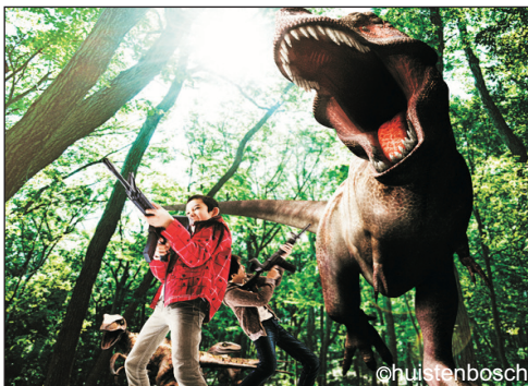
豪斯登堡(AR恐龍射擊體驗)