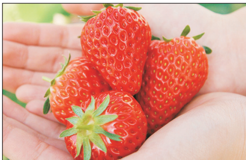
季節限定・增遊時令果園 【任摘任食時令士多啤梨約30分鐘】(註2)