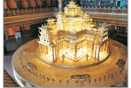
香巴拉藏文化博物館

△如遇大雪或大風等原因，石卡雪山索道停運，致不能遊覽，則改為遊覽普達措國家公園。