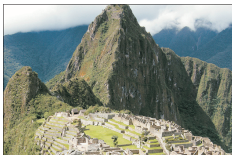
「世界文化遺產」馬丘比丘

3. 報名時客人另須付船上服務生小費，每人每晚美金$14.5，禮賓級艙房以上每人每晚美金$15，Cat S2或以上豪華套房，每人每晚美金$18，按船公司要求，此項小費須先由本公司代收。(如有更改，以郵輪公司公佈為準。)