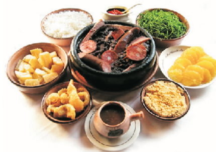
巴西國菜黑豆燉肉(Feijoada)