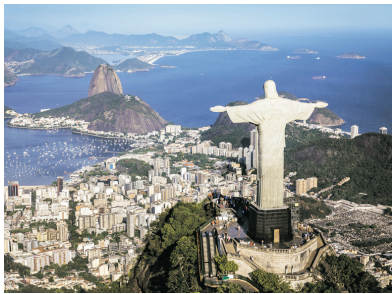
「新七大奇蹟」基督山