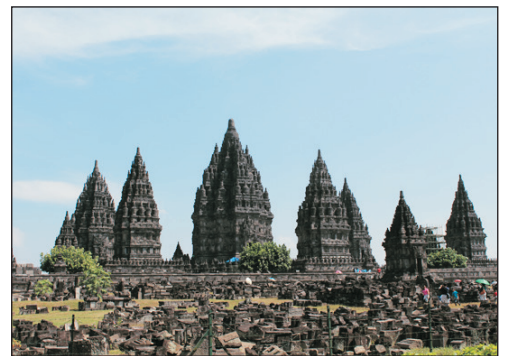
世界文化遺產~普蘭巴南神廟