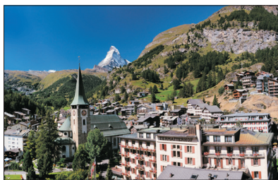
「無煙環保城」 采爾瑪特

遊覽風景怡人的采爾瑪特，瑞士有九個環保鎮，全城沒有汽車，只有小量以電池推動的小車作運輸之用，居民都喜愛徒步於大街小巷，間中更可見以馬車代步的居民，煞是有趣！