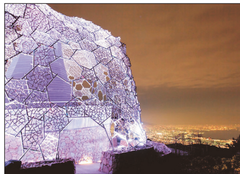
六甲山垂枝展望台夜景