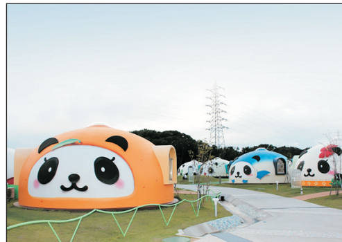
保證入住白濱熊貓圓頂小屋