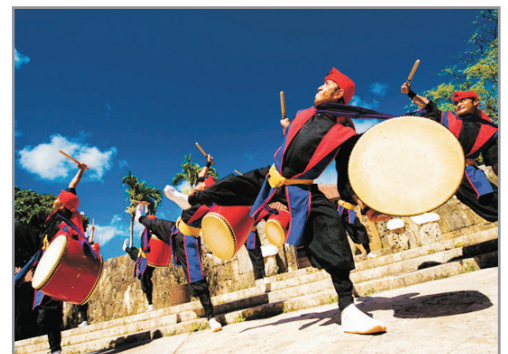
琉球王國村太鼓表演