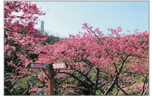
【季節限定】 增遊八重岳～觀賞全日本最早開櫻花 (2019年1月24日至2月3日出發適用)(註6)