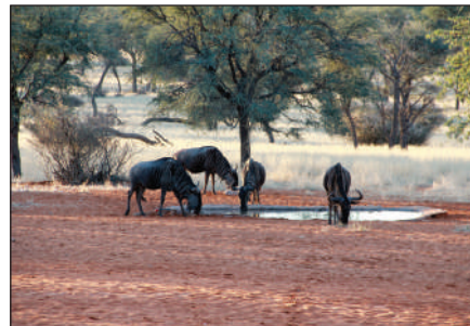
卡拉哈里沙漠盆地