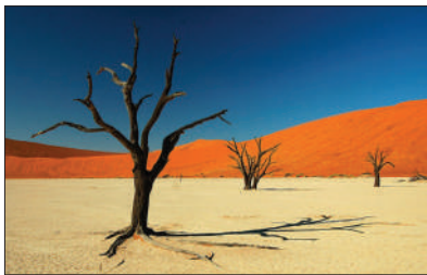
「非洲秘境」 納米比亞