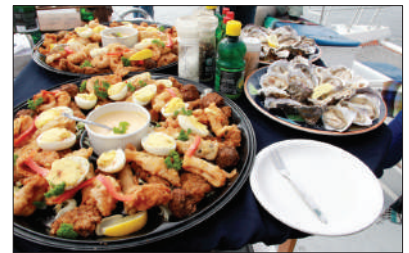
「美食饗宴」 納米比亞

埃托沙國家公園，曾是地球上最大的野生動物保護區，可觀非洲五大動物!是觀賞野生動物的絕佳去處，還有十億年前形成的巨大鹽沼，更是自然界的奇觀。(9天團適用)