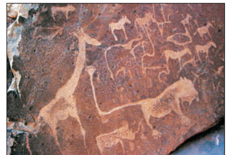
特威飛爾泉非洲岩畫