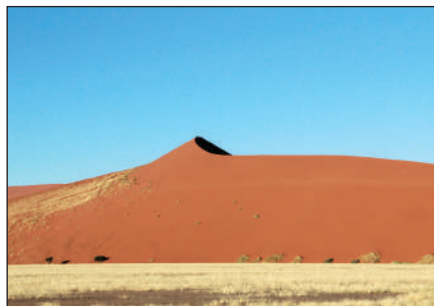
奈米布沙漠~世界最高沙丘