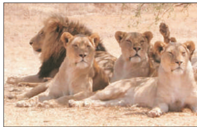
「野生動物的天堂」 埃托沙國家公園

埃托沙國家公園，曾是地球上最大的野生動物保護區，可觀非洲五大動物!是觀賞野生動物的絕佳去處，還有十億年前形成的巨大鹽沼，更是自然界的奇觀。(9天團適用)