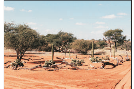
卡沙哈里沙漠盆地