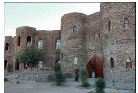
Le Mirage Desert Lodge