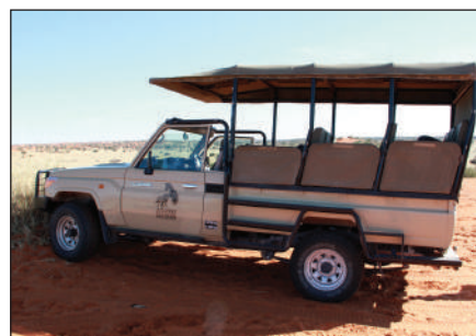
乘吉普車追蹤野生動物