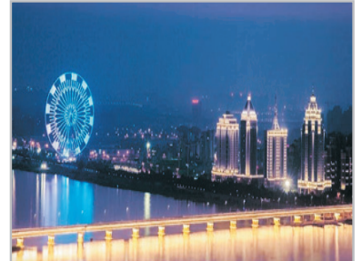
秋水廣場南昌之星

Day 4 南昌—江南三大名樓—滕王閣(遊覽時間約1.5小時)—江西省博物館(遊覽時間約40分鐘)—車遊八一廣場、八一起義紀念碑—南昌→香港 ~滕王閣：因「初唐四傑」之一王勃的《滕王閣序》而得以名貴古今，與湖南岳陽樓、湖北黃鶴樓並稱江南三大名樓。屢毀屢建，今日之滕王閣為1989年重建，與古貌相比更為氣派。