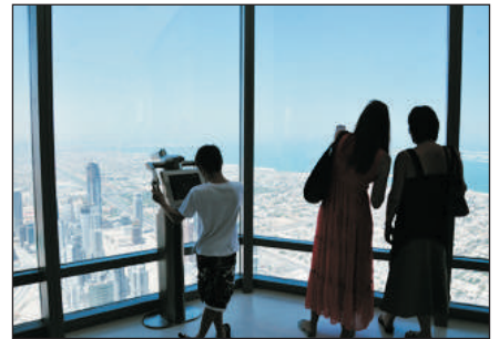
哈利法塔第124層觀光層

▲ 如遇上當地回教節日或慶典(如：齋戒月等)，肚皮舞表演將被取消，恕不另行通知。