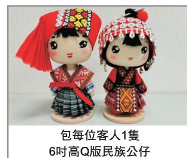
包每位客人1隻 6吋高Q版民族公仔

安順—安順文廟(遊覽時間約1小時)—雲峰屯堡古鎮(包景區電瓶車)【本寨、屯堡文化博物館、古巷道、觀賞屯堡特色地戲表演】(遊覽時間約2小時)—貴陽