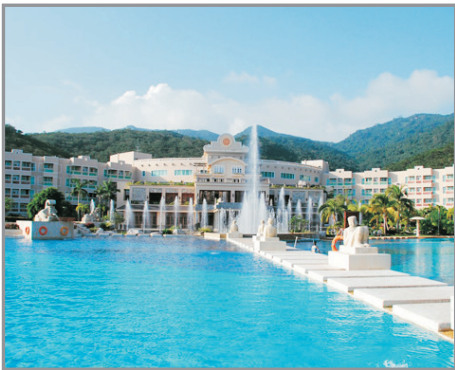
三亞凱萊仙人掌度假酒店

#寶亭荔苑溫泉酒店「荔瓊豪華溫泉房」原名為「山景獨立泡池客房」，房型及房內設施不變。如遇「荔瓊豪華溫泉房」房滿，將安排入住「荔瓊高級溫泉房」（房間均設獨立泡池）。