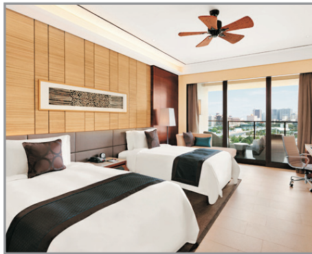
中心皇冠假日酒店