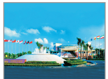
博鰲亞洲論壇成立會址