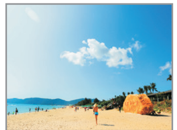
亞龍灣愛立方海濱樂園