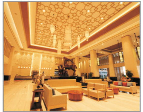
西藏大廈開元名都酒店