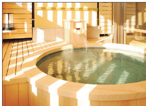
蘆原溫泉美松酒店

· 位於福井縣的北端，以豐沛優質的溫泉水而聞名，是北陸屈指可數的溫泉鄉！房間是特色和室，淡雅的設計給人溫馨悠然的感覺，亦能夠體驗日本獨有的榻榻米和日式寢具。特別安排入住私人個室露天風呂房，於酒店品嚐豐富晚餐後，可到日式造景庭園散步或回到房間享用私人露天風呂，讓您悠悠自在地享受專屬的溫泉，寫意度爆燈！(註1)