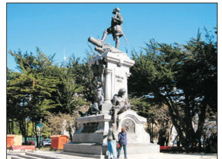
穆尼奧斯·加斯羅廣場