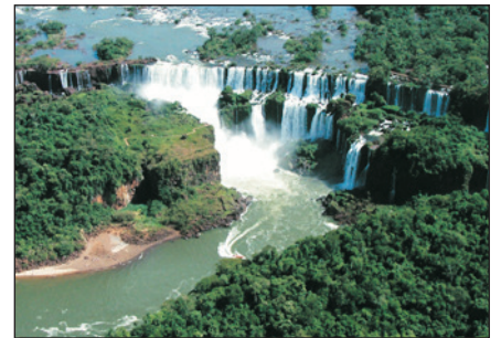
伊瓜蘇大瀑布(阿根廷境內)