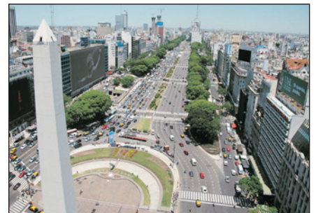
七月九日大道(布宜諾斯艾利斯)

· 「高卓人」於印第安語即「孤兒」的意思，在西班牙殖民時代逃亡到內陸草原過著刻苦的游牧生活，更被稱為「失落的民族」，是日將看到牧人穿著傳統的服飾，並欣賞舞蹈，品嚐葡萄酒及觀看馬術。