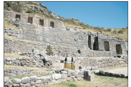
薩庫沙瓦曼城堡(庫斯科)