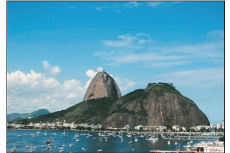
糖麵包山(里約熱內盧)