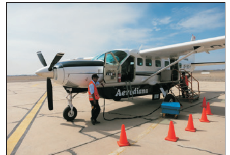
觀光小型飛機空中暢遊(秘魯)

· 納斯卡神秘線條 ：獨特的納斯卡神秘線條空中鳥瞰旅程，位於納斯卡的地上巨型圖案，是南美享負盛名的謎樣文化遺蹟。這些圖形之大，必須從空中俯瞰方能看清，過往不少科學家、天文學者花畢生的精力，嘗試解開這些線條之謎。有說是印第安人造來讓天神看的天文曆，叫天神得知他們的願望和心意；又有說是印加帝國時期的灌溉系統；有更誇張的則認為它們是以前外星人降落跑道的一部份。但究竟它們是誰人繪畫、為何繪畫及何時繪畫，至今仍然是個謎。團友將安排乘坐觀光飛機，於空中觀賞散布在納斯卡平原上各式直線、幾何模型及動物等圖案，感受其神秘之氣氛。