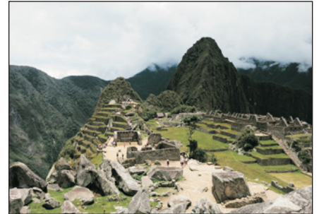
空中之城~馬丘比丘(秘魯)

#若因受天雨、山泥傾瀉或其他因素引致登山火車未能服務，本公司將安排團隊改乘坐旅遊巴士前往馬丘比丘，敬請留意。