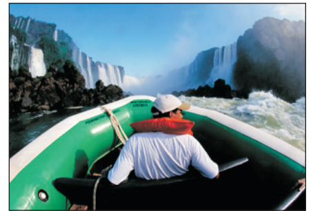
乘坐橡皮艇穿梭瀑布邊緣