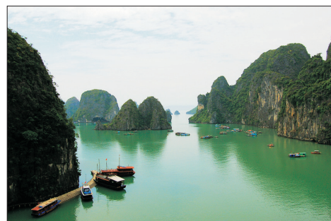
下龍灣海上風景區