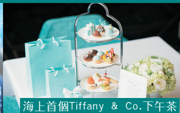
海上首個Tiffany & Co.下午茶