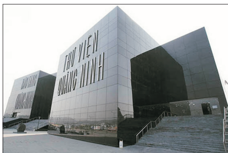
廣寧博物館(下龍灣)